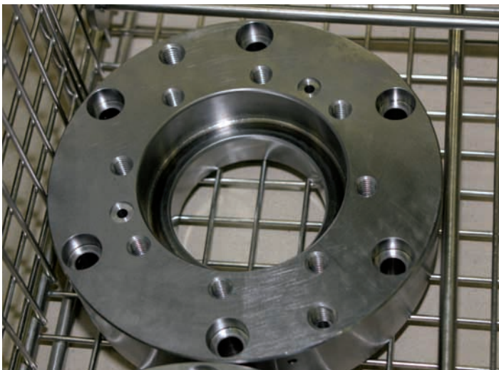
Sowohl die zu reinigenden Flansche als auch die Gehäuse weisen komplexe Geometrien mit vielen tiefen und zum Teil engen Bohrungen auf.