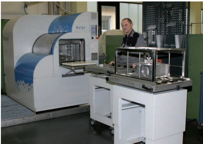
Die installierte Reinigungsanlage ist fester Bestandteil der Montagelinie und unmittelbar hinter dem Lager aufgebaut.