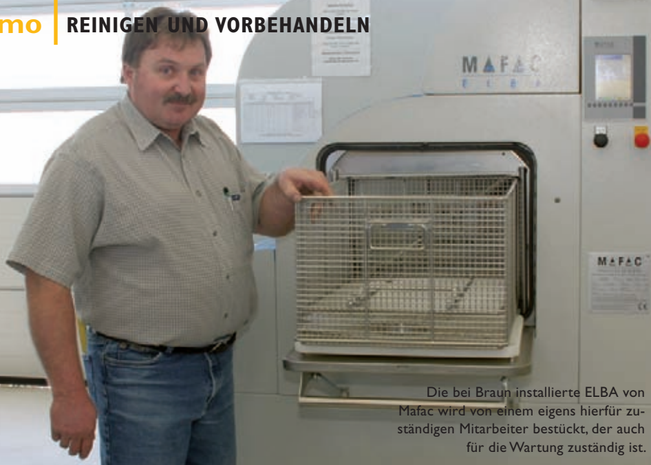
Die bei Braun installierte ELBA von Mafac wird von einem eigens hierfür zuständigen Mitarbeiter bestückt, der auch für die Wartung zuständig ist.